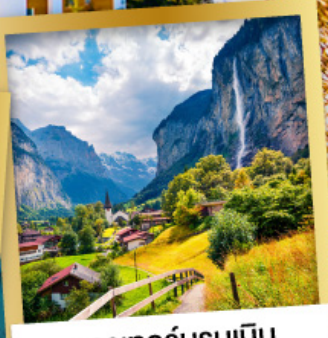
เลาเทอร์บรุนเนิน