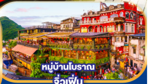
หมู่บ้านโบราณ จัวเฟิ่น