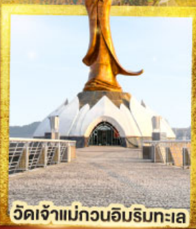
วัดเจ้าแม่กวนอิมริมทะเล