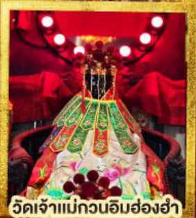
วัดเจ้าแม่กวนอิมฮ่องฮำ