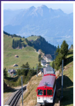
นั่งรถไฟใต้เขาริกิ