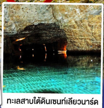
ทะเลสาบไ้ดินเซนที่เล็ยวาร์ด

ล่องเรือชมทะเลสาบไ้ดินเซนที่เล็ยวาร์ด ทะเลสาบไ้ดินลึกลับ สุดUnseenแห่งสวิตเซอร์แลนด์