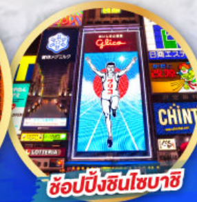
ช้อปปิ้งชินโซบาชิ

เดินทาง 14-19, 21-26 ม.ค. 68 06-11, 13-18 ก.พ. 68 13-18 มี.ค. 68