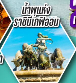
น้ำพุแห่งราชินีเดฟวอน

ค้างคืนบนเรือสำราญ 2 ลำ เรือสำราญ TALLINK SILJA LINE และ เรือสำราญ DFDS