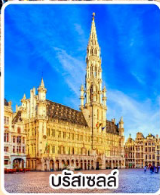
บรีซาเซล