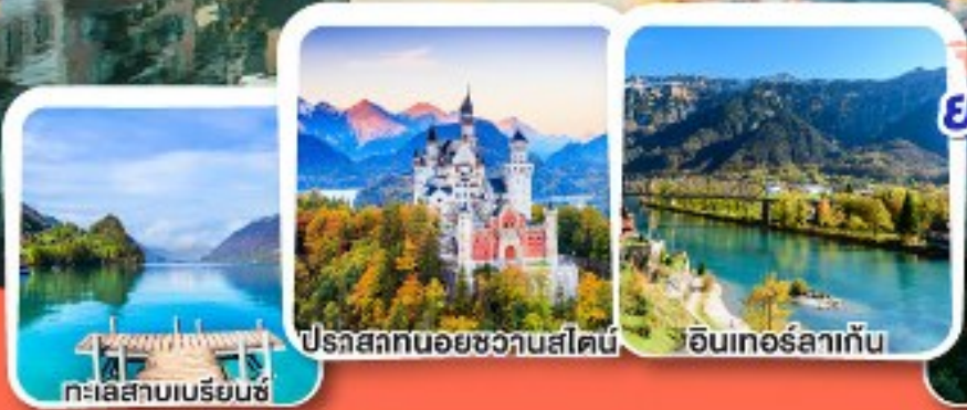
ทะเลสาบเบรียมนซ์

การันตีได้ค้ำคินบน ยอดเขาริกี ราชินีแห่งขุนเขาสวิส.