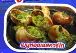
เมนูหอยแอสคาร์โท