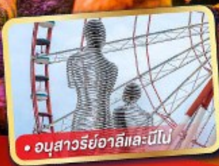
• อูบาสวารียาลีและนิโป