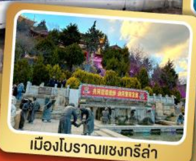
เมืองโบราณแชงกรี่ล่า