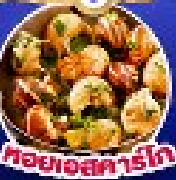
คอกเทลสตาร์โท

เดินทาง 5 17-25 ก.ย.67/11-19,18-26 ต.ค.67 14-22 พ.ย.67/30 พ.ย.-8 ธ.ค.67 25 ธ.ค.67 - 2 ม.ค.68(เทศกาลปีใหม่)