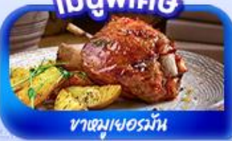
ขาหมูเยอรมัน