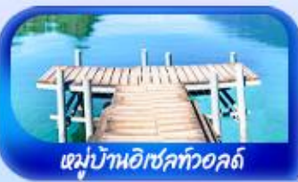
หมู่บ้านอิเซลทออลด์