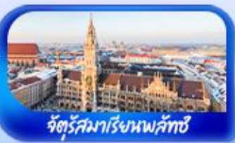
จัตุรัสมาเรียเนพลิกซ์