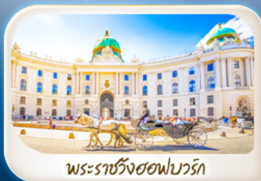
พระราชวังฮอฟบวร์ก

12-18 มี.ค.68 / 19-25 มี.ค.68 28 เม.ย. - 4 พ.ค.68 7-13 พ.ค.68