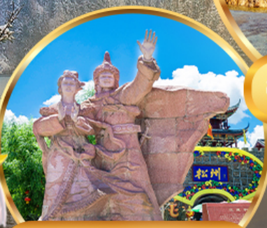
เมืองโบราณขงฟาน