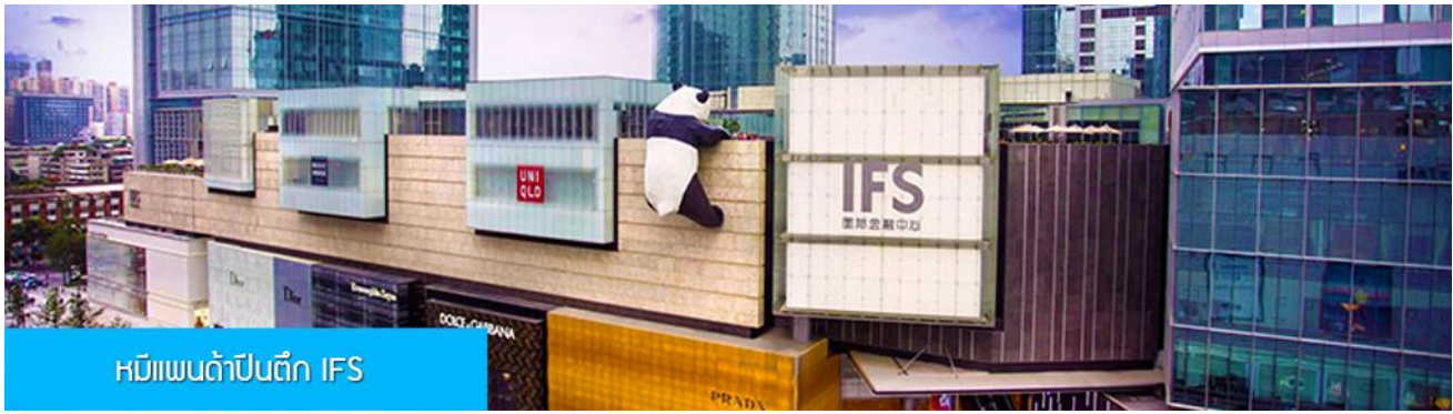
หมีแพนด้าปีนตึก IFS

ชม หมีแพนด้าปีนตึก ณ ตึก IFS 熊猫爬楼 จุดเช็คอินใหม่สำหรับชาวเมืองเจียงตูและนักท่องเที่ยวผู้มาเยือน ท่านจะได้ตะลึงกับตึกตาแพนด้ายักษ์ที่มีความสูง 15 เมตร น้ำหนัก 13 ตัน ปีนเกาะอยู่บนยอดตึก IFS ใจกลางเมืองเจียงตู.