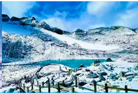
ทะเลสาบต้ากู่