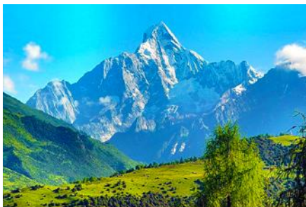
อุทยานภูเขาลี้ครุณี

พักที่ SI GUNIANG SHAN HOTEL 4* หรือระดับ4ดาวพื้นเมือง