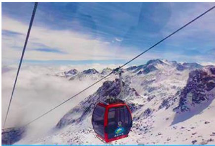
นั่งกระเช้าสู่อุทยานสวรรค์ ภูผาหิมะ-การ์เซียต้ากู่