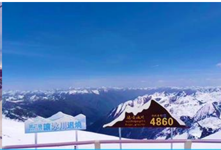
อุทยานสวรรค์ภูผาหิมะ-การ์เซียต้ากู่