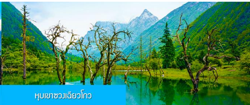
หุบเขาชวงเฉียวโกว