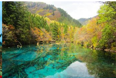
อุทยานจิวจ้ายโกว