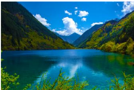
ทะเลสาบแรด (RHINO LAKE)

หลังอาหารเช้า นำท่านเดินทางสู่ อุทยานแห่งชาติจิวจ้ายโกว 九寨沟景区 ตั้งอยู่ด้านทิศเหนือของมณฑลเสฉวน ซึ่งเป็นส่วนหนึ่งในบริเวณตอนใต้ของเทือกเขาหิมิงซาน ห่างออกไปจากตัวเมืองเจียงตูราว 500 กิโลเมตร จิวจ้ายโกวมีชื่อเสียงด้านความงามแห่งสีสันที่แปลกเปลี่ยนไม่รู้จบ ทะเลสาบผุดขึ้นท่ามกลางหมอกเมฆไม้เขียวขจี น้ำใสเป็นประกายชุ่มฉ่ำ ยอดเขาหิมะตัดกับท้องฟ้าสีคราม เกิดเป็นภาพธรรมชาติอันงดงามที่แปรเปลี่ยนไปตามฤดูกาลผลิ ด้วยความสวยงามจึงทำให้อุทยานแห่งชาติจิวจ้ายโกว ได้ถูกขึ้นทะเบียนเป็นมรดกโลกทางธรรมชาติในปีค.ศ. 1992