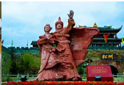
เมืองโบราณซงพาน