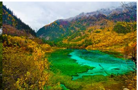
ทะเลสาบนกยูง (PEACOCK LAKE)

นำท่านชม ทะเลสาบยาว 长海 เหนือระดับน้ำทะเล 3,101 เมตร น้ำลึกโดยเฉลี่ย 90 เมตร ยาวราว 4.5 กิโลเมตร กว้าง 300 เมตร เป็นทะเลสาบที่มีขนาดใหญ่ และมีปริมาณน้ำมากที่สุดในอุทยานจิวจ้ายโกว ตั้งอยู่จุดเหนือสุดในอุทยาน น้ำในทะเลสาบยาวเกิดจากการละลายของหิมะบนภูเขา แม้ว่าทะเลสาบแห่งนี้จะไม่มีทางน้ำเข้าออก แต่ในฤดูร้อนและฤดูฝนน้ำในทะเลสาบก็จะไม่ล้นเอ่อท่วม และในฤดูหนาวที่แห้งแล้งน้ำในทะเลสาบก็ไม่แห้ง