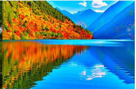
ทะเลสาบแพนด้า