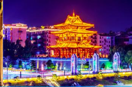
หอเขี้ยวเหยาโหลว

วันที่สี่ เมืองหยางซั่ว – ภูเขาหฺรูยี้ฟง – เมืองโบราณต้าชวี – เมืองกฺุ้ยหลิน – หอเขี้ยวเหยาโหลว – ซ้อปั้งย่าน ตงซีเจียง