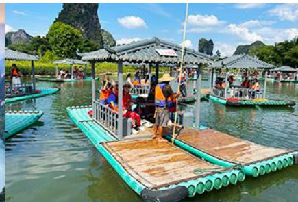
ขึ้นเรือแพชมม่านน้ำหลีเจียง