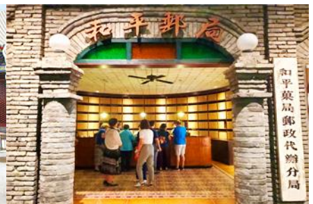
เมืองโบราณจำลอง