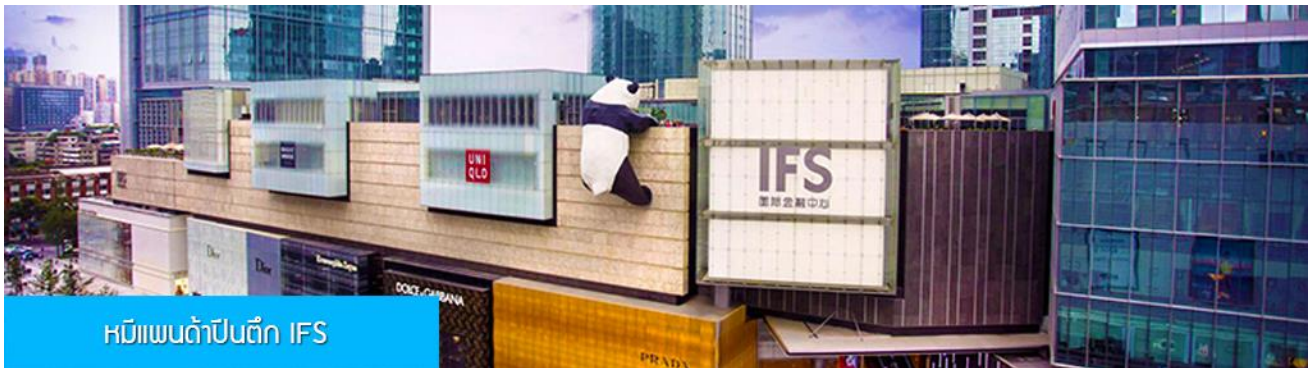
หมีแพนด้าปีนตึก IFS