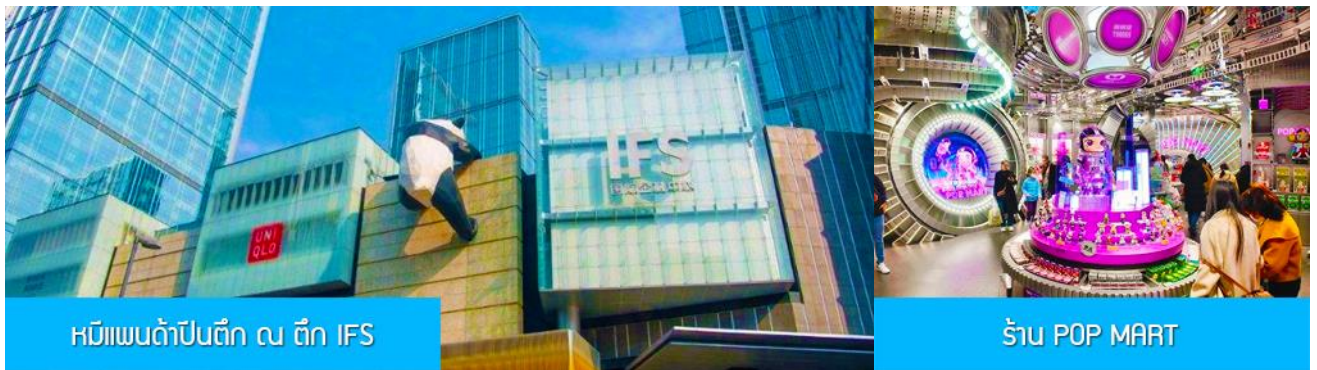
หมีแพนด้าปีนตึก ณ ตึก IFS

พักที่ DAGU GLACIER HOTEL 4* หรือ โรงแรมระดับเดียวกันพื้นเมือง