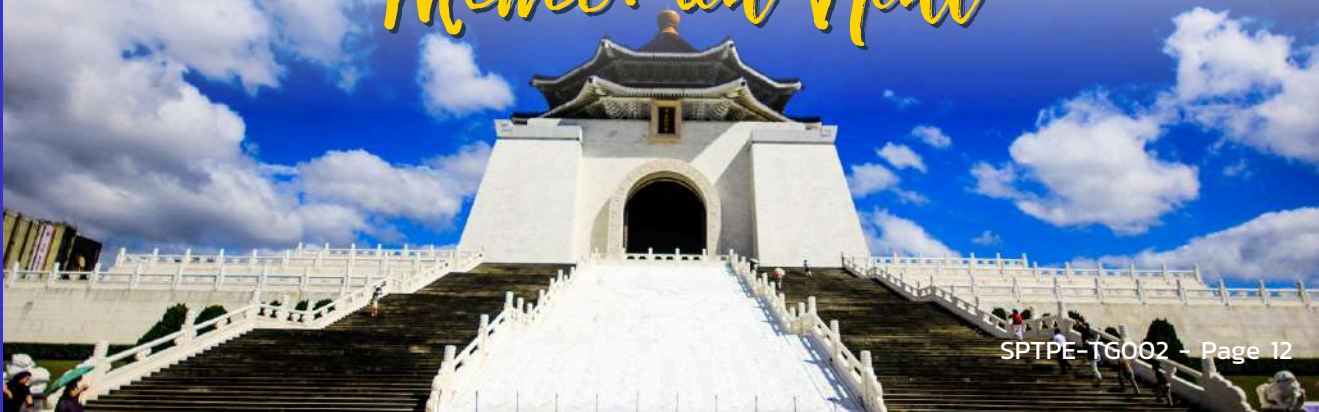
National Chiang Kai-Shek Memorial Hall

นำท่านเดินทางสู่ อนุสรณ์สถานเจียงไคเชก ตั้งอยู่ตรงใจกลางของเมืองไทเปที่มีพื้นที่ 2,500 ตารางกิโลเมตรแห่งนี้ถูกตกแต่งและประดับเป็นอย่างดี โดยตัวอาคารของอนุสรณ์สถานถูกสร้างขึ้นตามแบบสถาปัตยกรรมจีนโบราณ บันไดทั้งสี่ด้านถูกสร้างด้วยหินอ่อนสีขาวเป็นขั้นตามแบบพระมิดอียิปต์ หลังคาสีน้ำเงิน รวมทั้งยังมีสวนดอกไม้สีแดง ที่เป็นการแสดงออกทางสัญลักษณ์ให้เห็นถึงอิสรภาพ ความเท่าเทียม และความเป็นหนึ่งเดียวกัน ตามสีของธงชาติไต้หวัน สถานที่แห่งนี้นอกจากจะเป็นแลนด์มาร์คอันสำคัญของไทเปที่มีนักท่องเที่ยวมาเยี่ยมชมอย่างไม่ขาดสายแล้ว ยังเป็นโรงละครแห่งชาติและสถานที่สำหรับจัดคอนเสิร์ตของไต้หวันที่มีการแสดงจากศิลปินและนักร้องชื่อดังมากมายให้ผู้คนใจได้เข้าร่วมตลอดทั้งปี