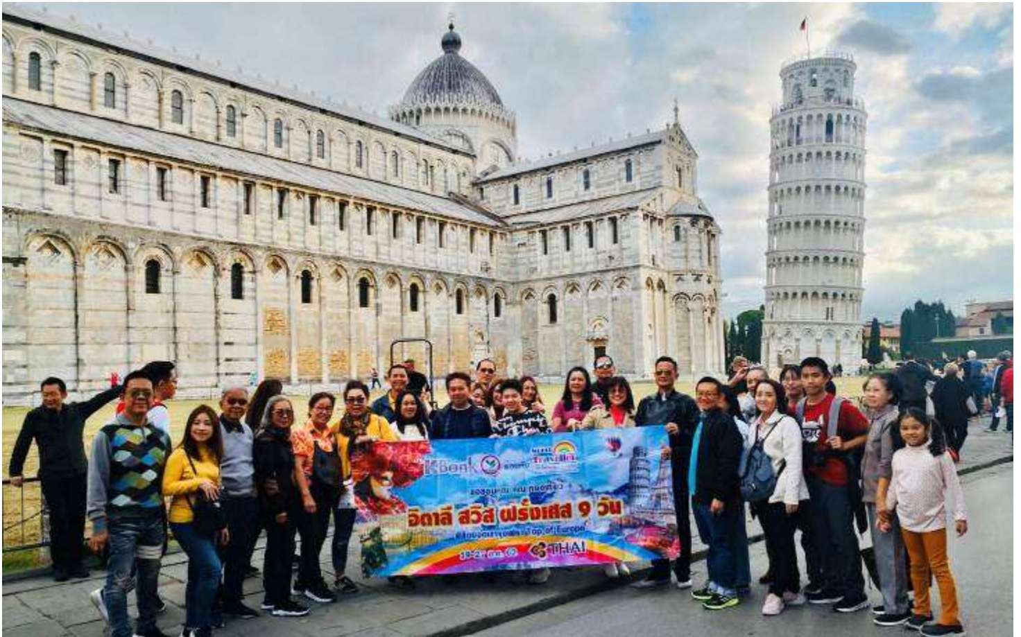
แอนด์สวิตเซอร์แลนด์8วัน TG PROMOTION2 วันที่ 13-20 ต.ค.2562 (จำนวน42ท่าน)