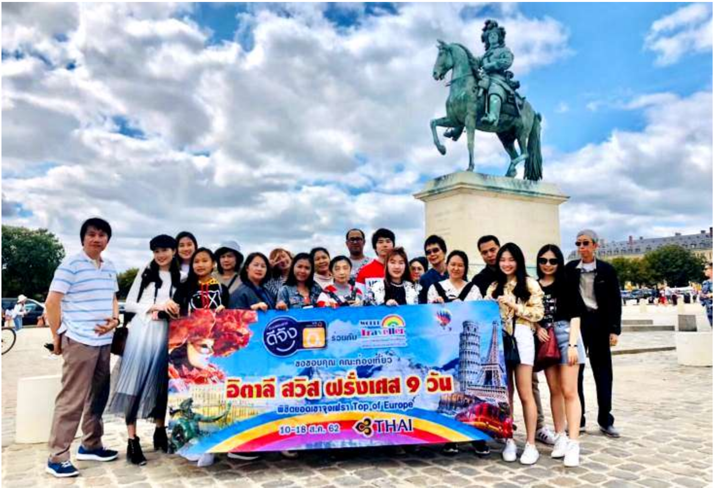
อิตาลี-สวิตเซอร์แลนด์-ฝรั่งเศส 9วัน TG PROMOTION4 วันที่ 13-21ก.ค.2562 (จำนวน26ท่าน)