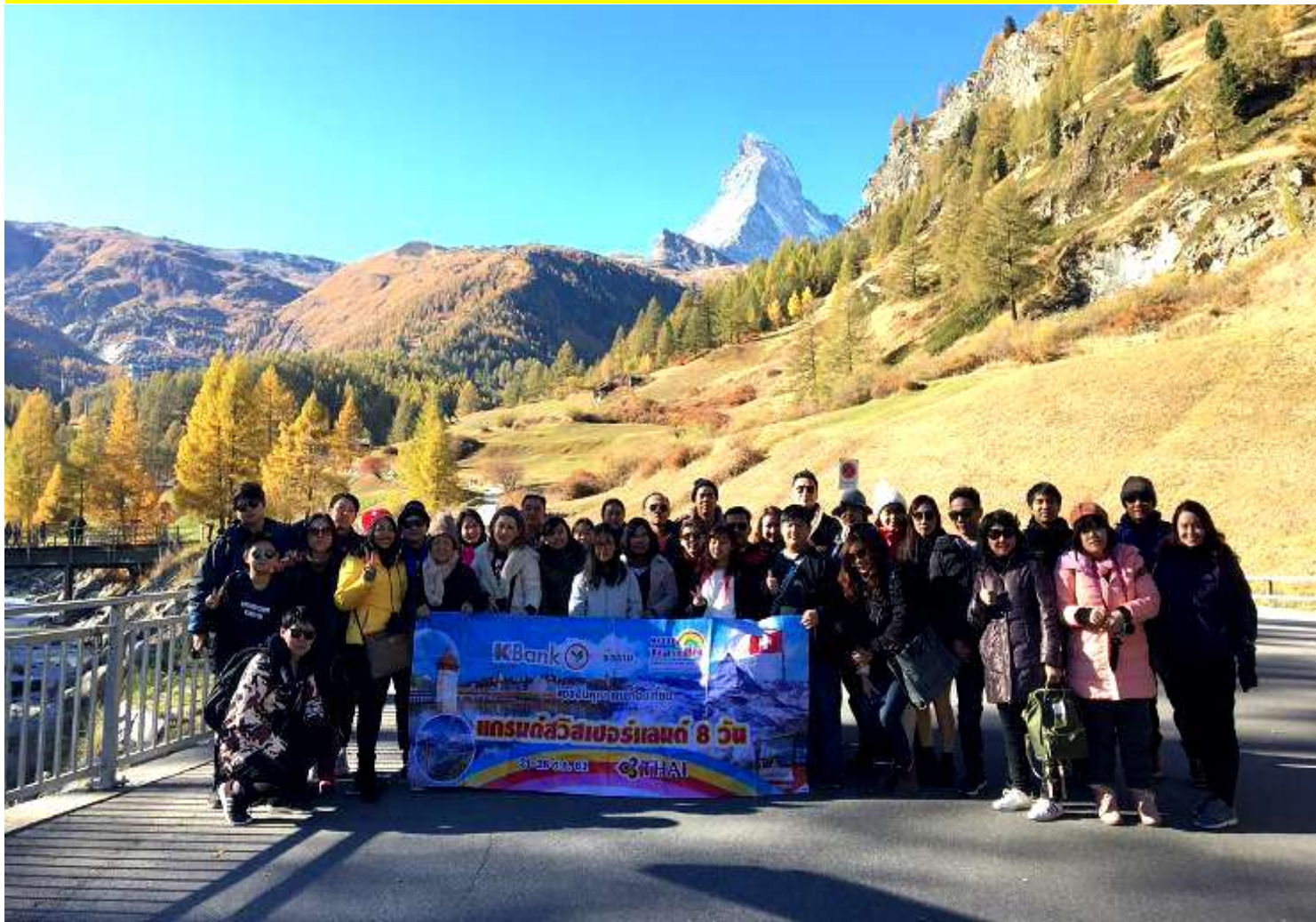
อิตาลี-สวิสเซอร์แลนด์-ฝรั่งเศส 9 วัน TG PROMOTION 4 ช่วงหยุดปี: 20-28 ต.ค. 2561 (จำนวน 40 ท่าน)