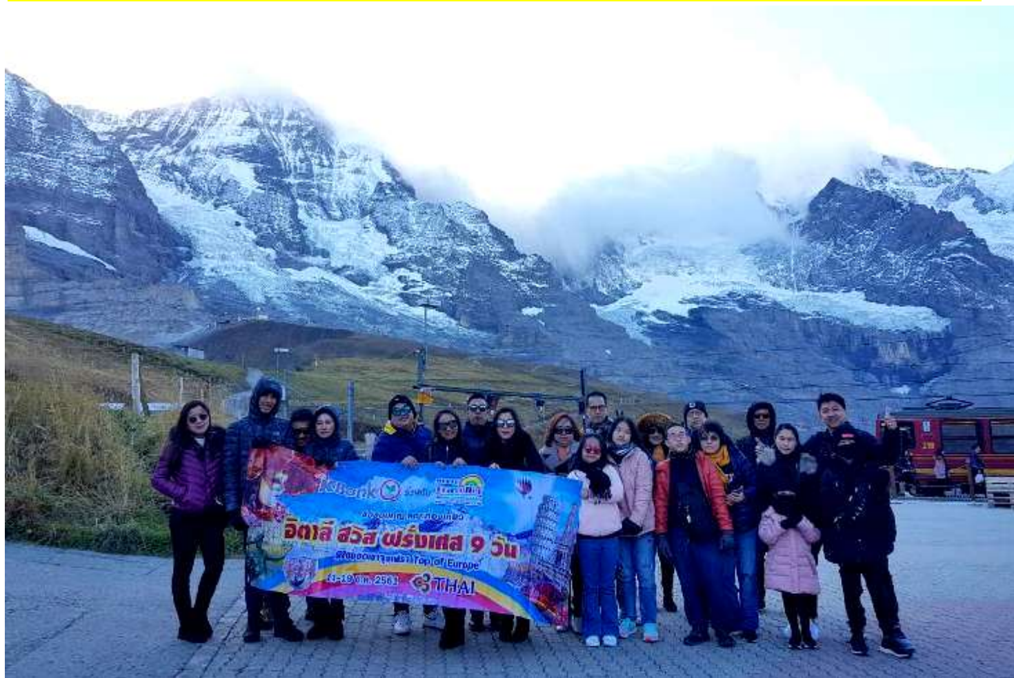
อิตาลี-สวิสเซอร์แลนด์-ฝรั่งเศส 9วัน TG PROMOTION4 เดินทางวันที่ 06-14 ต.ค.2561(จำนวน20ท่าน)