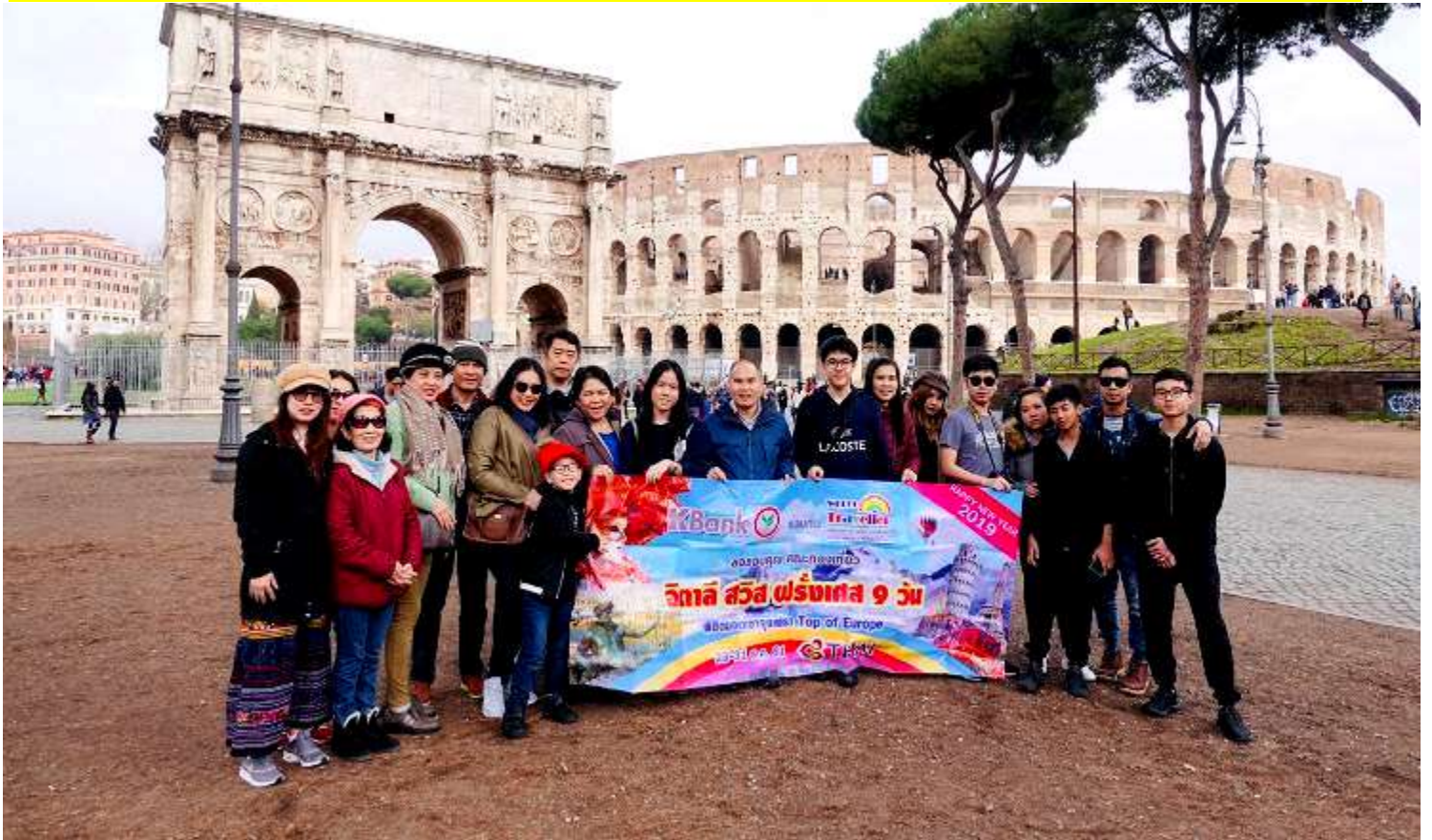
อิตาลี-สวิตเซอร์แลนด์-ฝรั่งเศส 10วัน TG DELUXE เดินทางปีใหม่ 22-31ธ.ค.2561(จำนวน20ท่าน)