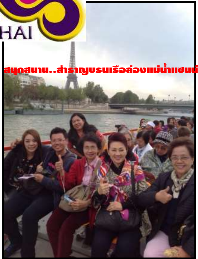
สนุกสนาน..สำราญชมเรือล่องแม่น้ำแซน

เรากำลังรอรับเกียรติจากทางท่าน...มาใช้บริการทัวร์ที่ดีจากทางเรา