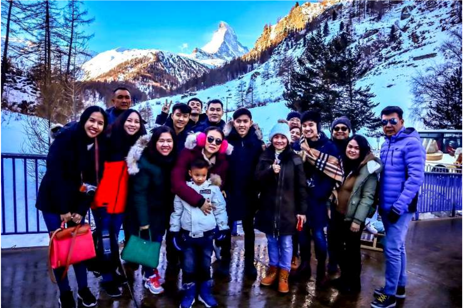
ยุโรปตะวันออก 9วัน TG DELUXE พัก Hallstatt เดินทางปีนํ 29ค.ค.-06ม.ค.2562(จํนวน28ทํน)