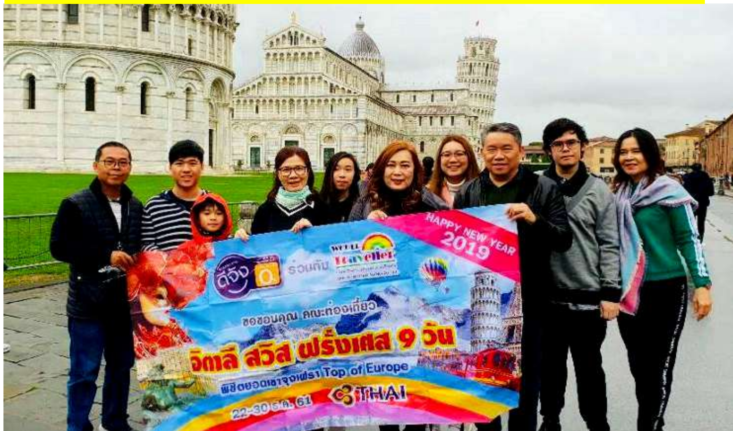
อิตาลี-สวิตเซอร์แลนด์-ฝรั่งเศส 9วัน TG PROMOTION4 เดินทาง 15-23 ธ.ค.2561(จำนวน32ท่าน)