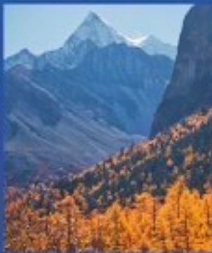
อุทยานมรดกโลก ภูเขาสัตตรุณี