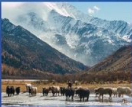
อุทยานมรดกโลก ภูเขาสัตตรุณี อุทยานแห่งชาติระดับ 5A

เมืองดู-เมืองโบราณลั่วโถ้ว-บ้านดินแห่งเสฉวน ถนนคนเดินซูบซีลู่-POP MART-สะพานทนานเจียว อุทยานสัตตรุณี-ชวงเจียวโกว-ถนนโบราณควาเป่าไฉ่ยงจื่อ