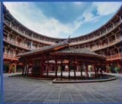
เมืองโบราณลั่วโถ้ว บ้านดินแห่งเสฉวน