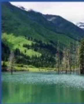
ทะเลสาบเจียวโกว