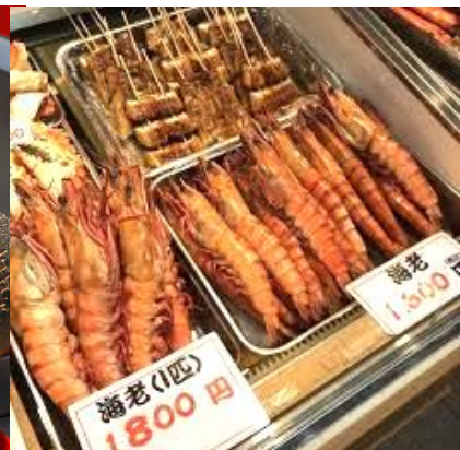
เที่ยวเพลิน แคมอัมท็อง