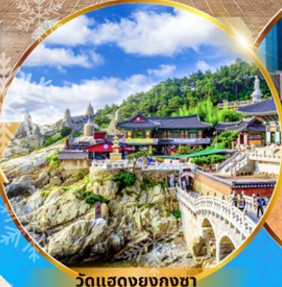
วัดแสตงยงกุงซา