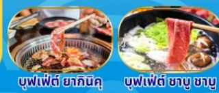
บุฟเฟ่ต์ ฮากิชิคุ บุฟเฟ่ต์ ซาซุ ซาซุ

THAI สายการบินไทย บริการอาหารร้อน นน.กระเป๋า 23 กก. เอนเตอร์เทนเมนท์ฟรี