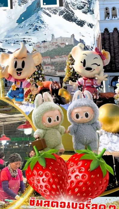
ตลาดกวางจง