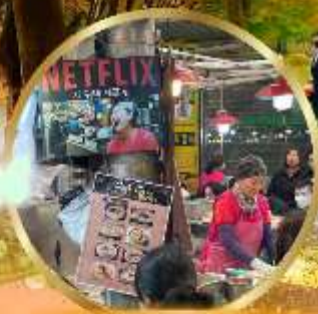
สตริกฟู้ดตลาดกวางจ้ง

สนุกสุดเหวี่ยงกับกิจกรรมขัสน LUGE !! พิเศษ !! นั่งกระเช้าชมวิว 360° เมืองคังฮวา