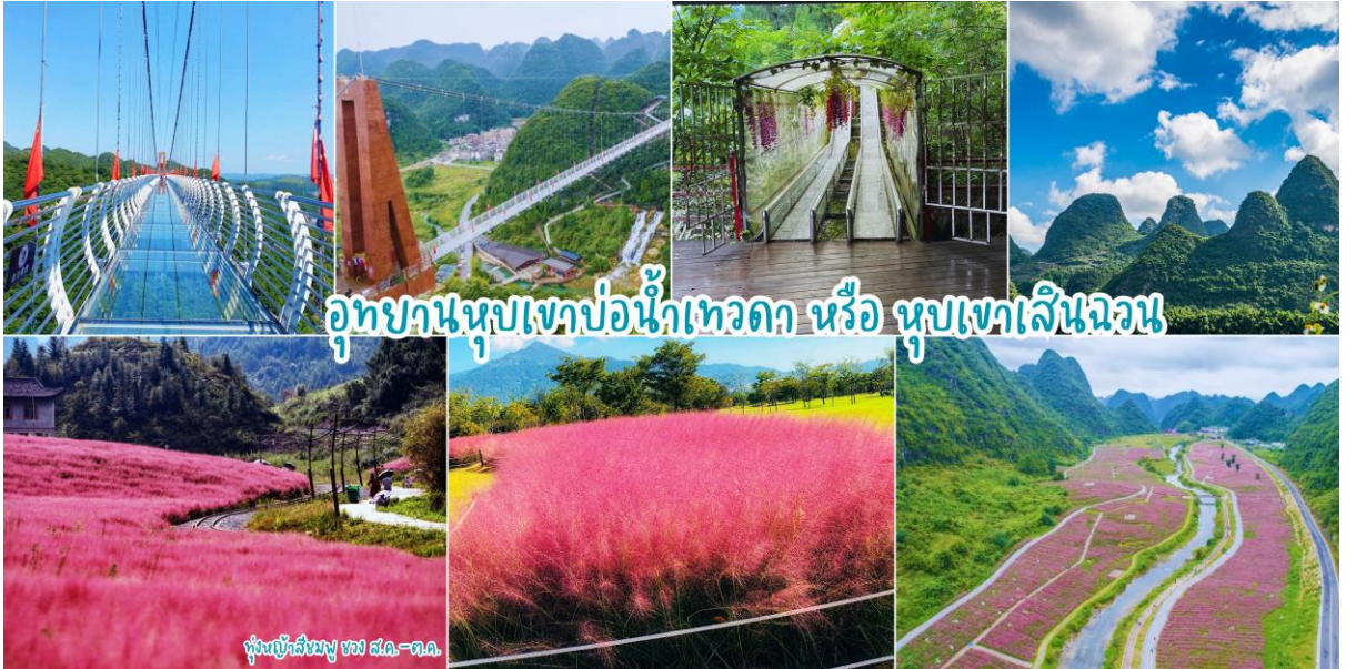
อุทยานหุบเขาบ่อน้ำเทวดา หรือ หุบเขาเสินฉวน

เช้า |๑|รับประทานอาหารเช้า ณ ห้องอาหารของโรงแรม หลังอาหารเช้าท่านเดินทาง อุทยานหุบเขาบ่อน้ำเทวดา หรือ หุบเขาเสินฉวน (ค่ารถแบตเตอรี่) มณฑลกุ้ยโจว เป็นแหล่งท่องเที่ยวที่คุณจะได้สัมผัส ดื่มด่ำกับธรรมชาติอย่างแท้จริง และสถานที่แห่งนั้นก็คือ “จุดชมวิวกุ้ยเขาเสินฉวน” เป็นสถานที่ท่องเที่ยวสุด UNSEEN ที่ชื่อเสียงของชาวจีน จุดชมวิวกุ้ยเขาเสินฉวน ตั้งอยู่ท่ามกลางธรรมชาติ ขุนเขา ป่าไม้ ธารน้ำและทุ่งดอกไม้ ที่อุดมสมบูรณ์สวยงาม ในเขตปกครองตนเองชนกลุ่มน้อยเผ่าเหมียวและปู้อี้ ฉะนั้นหากท่านอยากชมความงามของมณฑลกุ้ยโจวทางตะวันตกเฉียงใต้ของจีน ซึ่งเสน่ห์ที่ชวนดึงดูดให้นักท่องเที่ยวผู้ชื่นชอบธรรมชาติจากทั่วทุกสารทิศอยากจะมาเยือนที่จุดชมวิวกุ้ยเขาเสินฉวนแห่งนี้ นำท่านชมบ่อน้ำเทวดา ลักษณะเป็นบ่อน้ำพลูร้อนที่เกิดขึ้นตามธรรมชาติ เป็นสถานที่ที่ชาวกุ้ยโกวนิยมมาขอพรให้กิจการการงานราบรื่น จากนั้นนำท่านชมวิวกุ้ยเขาที่หยอด โดยสัมผัสความหวาดเสียว ณ สะพานกระจกหุบเขาน้ำพลูเทวดา (รวมค่าบัตรโดยสาร 1เที่ยว) สะพานแก้วมีความยาว 324 เมตร สูง 188 เมตร ให้ท่านได้ชมวิวดงงามด้วยยอดเขาที่หนาแน่นและแปลกตาและภาพรวมที่สมบูรณ์แบบ รูปร่าง ได้รับการยกย่องจากผู้เชี่ยวชาญและนักท่องเที่ยวมากมายว่าเป็น “สิ่งมหัศจรรย์ของโลก” นำท่านชมทุ่งดอกไม้ตามฤดูกาลที่มีความสวยงามแฉะถ้าयरูปตามจุดชมวิวกุ้ยเขา (ในช่วงเดือน พ.ค.-ส.ค.67 ท่านจะได้ชมทุ่งทานตะวันหรือดอกไม้อื่นๆ // ในช่วงปลายส.ค.-ต.ค.67ท่านจะได้ชมทุ่งหญ้าสีชมพู)