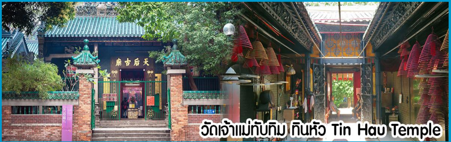
วัดเจ้าแม่ทับทิม ทินหัว Tin Hau Temple

นำท่านไปไหว้ เจ้าแม่กวนอิมฮงฮำ (Kun Im Temple Hung Hom) เป็นวัดเจ้าแม่กวนอิมที่มีชื่อเสียงแห่งหนึ่งในฮ่องกง ขอพรเจ้าแม่กวนอิมพระโพธิสัตว์แห่งความเมตตา ช่วยคุ้มครองและปกป้องรักษาวัดเจ้าแม่กวนอิมที่ Hung Hom หรือ “Hung Hom Kwun Yum Temple” เป็นวัดเก่าแก่ของฮ่องกงสร้างตั้งแต่ปี ค.ศ. 1873 ถึงแม้จะเป็นวัดขนาดเล็กที่ไม่ได้สวยงามมากมาย แต่เป็นวัดเจ้าแม่กวนอิมที่ชาวฮ่องกงนับถือมาก แทบทุกวันจะมีคนมาบูชาขอพรกันแน่นวัด ถ้าใครที่ชอบเสี่ยงเซียมซีเซาบอก ว่าที่นี่แม่นมากที่สุดที่พิเศษกว่านั้น นอกจากสักการะขอพรแล้วยังมีพิธีขอของอั้งเปาจากเจ้าแม่กวนอิมอีกด้วย ซึ่งคนส่วนใหญ่จะ นิยมไปในเทศกาลตรุษจีนเพราะเป็นศิริมงคลในเทศกาลปีใหม่ ซึ่งทางวัดจะจำหน่ายอุปกรณ์สำหรับเซียมซีเซาบอกของแดงไว้ให้ ผู้มาขอพร เมื่อสักการะขอพรโชดลากแล้วก็นำของแดงมาวนเหนือกระถางรูปหน้าองค์เจ้าแม่กวนอิมตามเข็มนาฬิกา 3 รอบ และเก็บของแดงนั้นไว้ซึ่งภายในช่องจะมีจำนวนเงินที่ทางวัดจะเซียมไว้เล็กน้อยแล้วแต่โชด ถ้าหากเราประสบความสำเร็จเมื่อมี โอกาสไปฮ่องกงอีกก็ค่อยกลับไปทำบุญ ช่วงเทศกาลตรุษจีนจะมีชาวฮ่องกงและนักท่องเที่ยวไปสักการะขอพรกันมากขนาด ต้องต่อแถวยาวมาก คนที่ไม่มีเวลาก็สามารถใช้เวลาอื่น ๆ ตลอดทั้งปี เพื่อขอของแดงจากเจ้าแม่กวนอิมได้เช่นกัน โดยซื้อ อุปกรณ์เซียมซีเซาบอกจากทางวัดเพียงแต่เตรียมของแดงไปเอง (ในกรณีกับทางวัดไม่ได้เตรียมของแดงไว้ให้เนื่องจากไม่ได้อยู่ใน หน้าเทศกาล) แล้วก็ใส่ธนบัตรตามฐานะและศรัทธา เซียมจำนวนเงินที่ต้องการลงไปด้วย ใส่สกุลเงินยิ่งดีใหญ่ แล้วก็ไหว้ด้วย พิธีเดียวกัน ถ้าประสบความสำเร็จตามที่มุ่งหวังค่อยกลับมาทำบุญที่นี่ในโอกาสหน้า