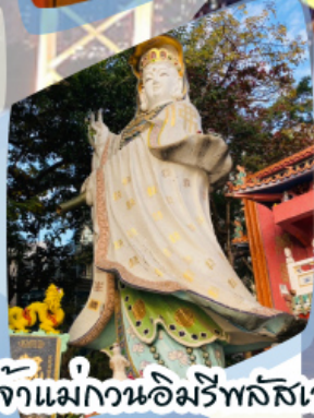
เจ้าแม่กวนอิมรัพลัสเบง