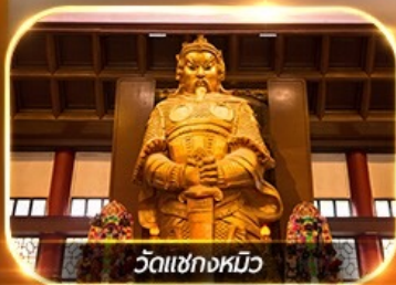
วัดเขากงหมิว