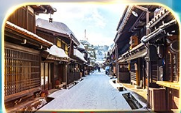
เมืองเก่าซันมาชิซูจิ