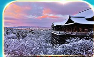
วัดคิโยมิสึ