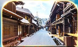
เมืองเก่าซันมาชิซูจิ