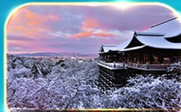
วัดคิโยมิตสึ