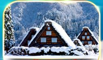
หมู่บ้านชิราคาวาโกะ

ชมความงามของปราสาทโอซาก้า ถ่ายรูปเชคอินป้ายกูลิโกะที่ซันโซมาชิ หมู่บ้านชิราคาวาโกะ วัดคิโยมิสึ วัดโทไดจิ ซันมาชิ ซูจิ