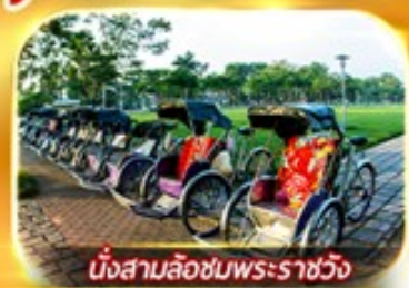
นั่งสามล้อชมพระราชวัง

สัมผัสความสวยงามหมู่บ้านสไตลฝรั่งเศสที่บานาฮิลล์ วัดเทียนมู่ พระราชวังเว้ สัมผัสเมืองโบราณฮอยอัน ล่องเรือกระดิง