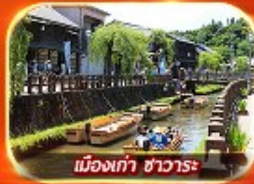
เมืองเก่า ซาวาระ