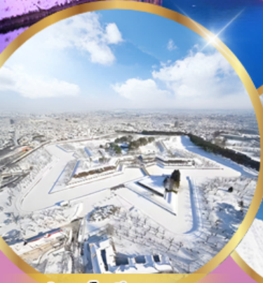
ป้อมโทเรียวคาคุ