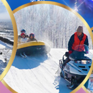
ซิกิไซ สโนว์แลนด์