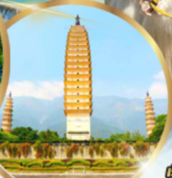
เจดีย์สามองค์