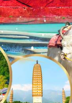
เจดีย์สามองค์