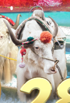
ราคาเริ่มต้น