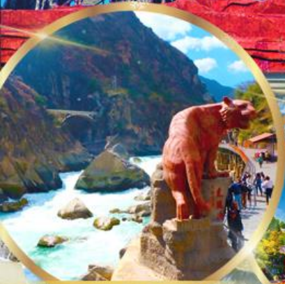
ช่องแคบเลือกระโจน