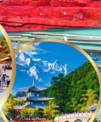
สระมิ่งกรดำ