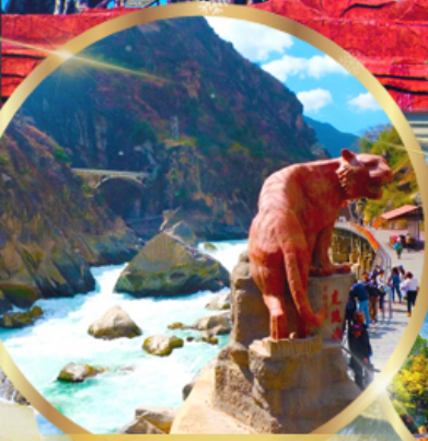
ช่องแคบเลือกระโจน