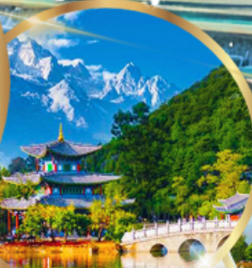
สระมิงกรดำ