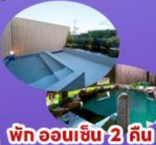
พักออนเซ็น 2 คืน