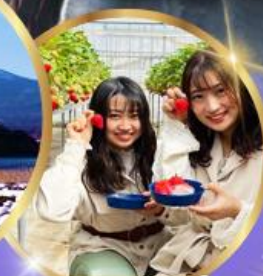
บุฟเฟต์ สดอเบอร์รี่ เก็บสดจากต้น