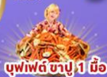
บุฟเฟต์ ซาปู 1 มื้อ