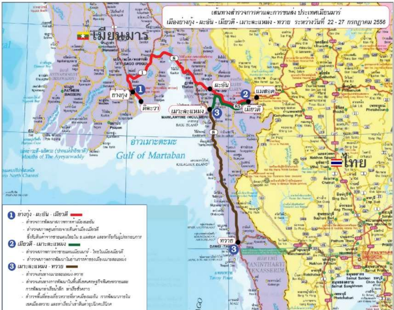
เส้นทางย่างกุ้ง - พะอั้น - เมียวดี - เมาะละเหม้ง - ทวาย