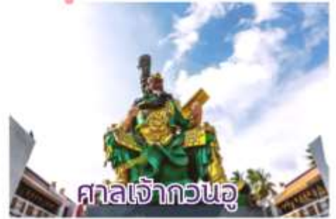
ศาลเจ้ากวนอู