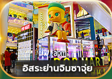
อิสระย่านจิมซาจุ่ย