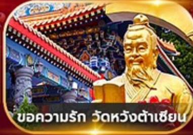
ขอความรัก วัดหวังต้าเซียน