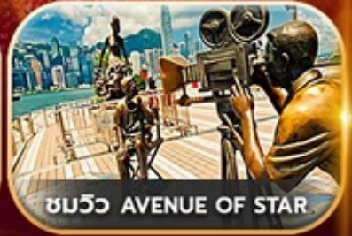
ชมวิว AVENUE OF STAR