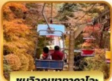
ชมวิวกุเขากาโอะ