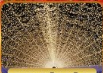
น้ำตกชิระโนะซาโตะ