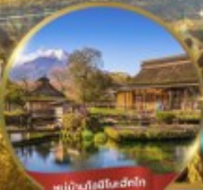
หมู่บ้านโธฮิเมะฮักโก