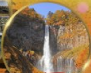
น้ำตกเคทงอน