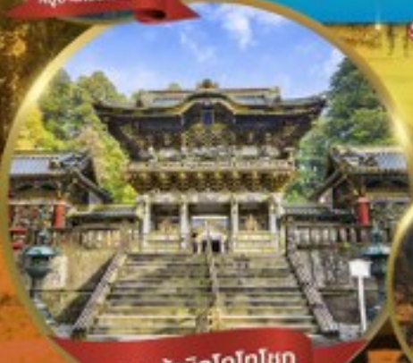
ศาลเจ้านิกโกโทโกโชกุ