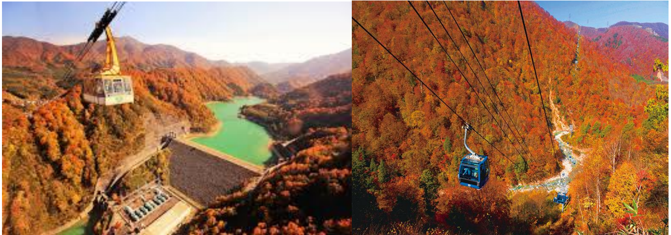
ของบริเวณโดยรอบ

Yuzawa Kogen Ropeway เป็นกระเช้าลอยฟ้าขนาดใหญ่ระดับโลกที่รองรับได้ถึง 166 คน ใช้เวลาเดินทางเพียง 7 นาทีบนเส้นทางราว 1,300 เมตรเชื่อมต่อระหว่างตีนเขากับ Panorama Park ที่อยู่เหนือระดับน้ำทะเลกว่า 1,000 เมตร หน้าสถานีพานoram่าบนยอดเขานั้นเป็นบริเวณที่มีบ่อแช่เท้าและระเบียงกลางแจ้ง ทั้งยังเชื่อมต่อกับ Kumo no Ue Cafe คาเฟ่ที่สามารถผ่อนคลายไปอย่างสบายๆ พลาชมวิวดูจุดสังเกตการของที่ราบ Uonuma และเทือกเขา Tanigawa ที่แผ่กว้างอยู่เบื้องหน้า Panorama Park เป็นบริเวณที่มีการแบ่งออกเป็นหลายโซน สามารถเพลิดเพลินไปกับกิจกรรมที่หลากหลาย เช่น การโหนซิปไลน์หรือการเดินป่าพลาชมทิวทัศน์สุดอลังการ