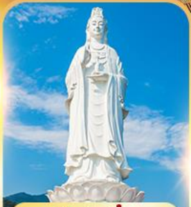
วัดหลินอิ่ง