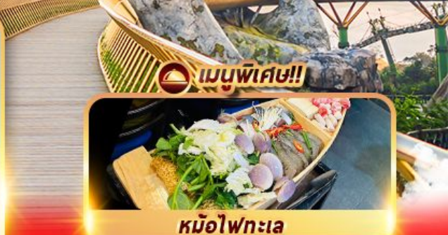
เมนูพิเศษ!! หม้อไฟทะเล