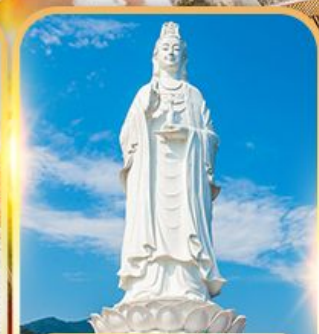
วัดหลินอิ่ง