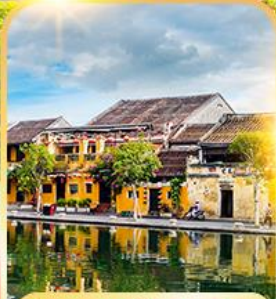
เมืองมรดกโลกฮอยอัน