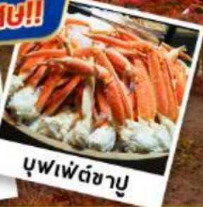
บุฟเฟต์ชาบู