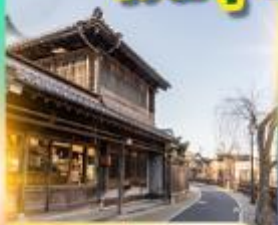
เมืองเก่าซาวาระ