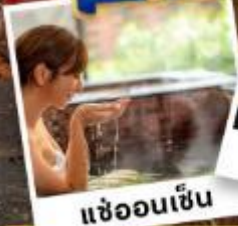
แซ่ออนเซ็น